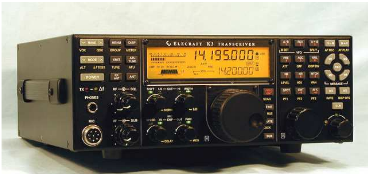
Abbildung 3: Frontansicht des Elecraft K3-Transceivers

Verglichen mit DL2NBU's Survey about Contest Radios (2004) [1]: Elecraft scheint das alles gelesen und beherrzt zu haben, denn es fehlt eigentlich nichts aus der Wunschliste von vor vier Jahren!