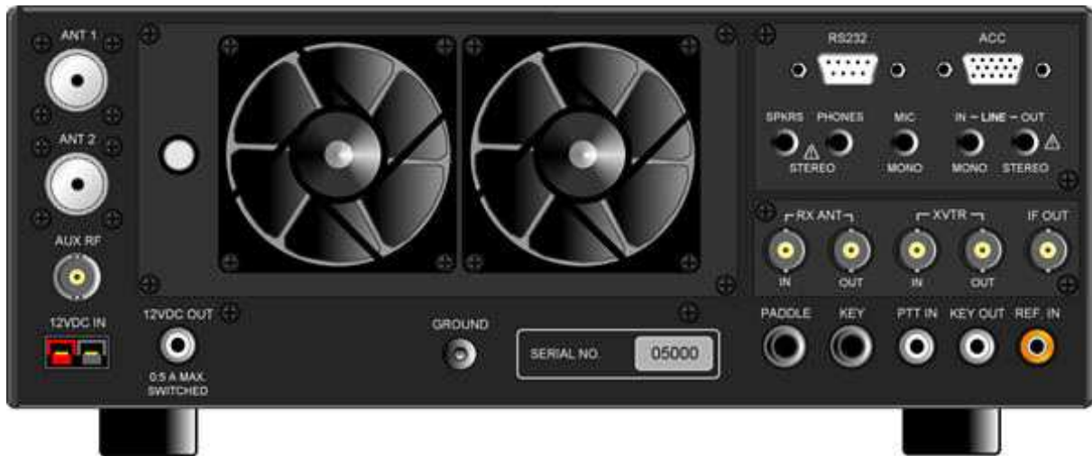
Abbildung 4: Rückseite des Elecraft K3-Transceivers